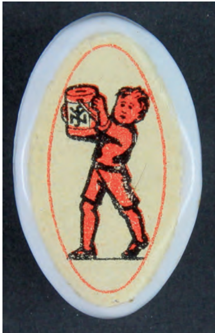
Abb. 3: Porzellanstecker, Historischer Verein Eichstätt

z.B. „ Warum kein Geld, warum keine Groschen, warum keinen Schein “. So lernten schon die Kleinsten, mit welchen Sprüchen sie die Großen zum Spenden motivieren. Ein kleiner Anstecker aus Porzellan zeigt ein Kind, das mit großer Kraftanstrengung die Sammelbüchse in die Höhe stemmt (Abb. 3). Kinder als Spendensammler garantieren meist einen guten Sammelerfolg, können die Erwachsenen ihnen oft weniger leicht eine Absage erteilen.