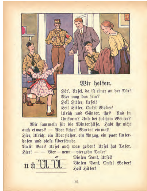
Abb. 1: Frohes Lesen (Kat. 3a)

Die Kinder wurden ganz selbstverständlich in die Sammelaktionen miteingebunden. Schon in den Lesebibeln der ersten Klasse suggerieren Texte und Bilder, dass man als Kind beim WHW aktiv wird. In der Fibel Frohes Lesen (Kat. 3a, S. 46) spendet eine Familie Kleidung, die Tochter Ursel hingegen 14 „Taler“ in die rote Sammelbüchse, die sie in der Hand schwenkt (Abb. 1). In der Fibel für die deutsche Jugend (Kat. 3d) ist ein Hitlerjunge abgebildet (Abb. 2), der die typische rote Sammelbüchse hochhält und in der anderen Hand eine Schachtel mit den Spendenbelegen trägt. In dem begleitenden Lückentext sollten verschiedenen Geldbegriffe eingesetzt werden,